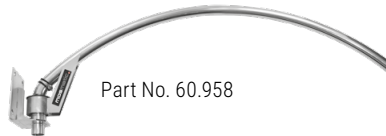
Part No. 60.958